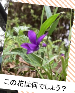
この花は何でしょう？

今回、アンケートを実施いたしまして様々な気付きがありました。貴重なご意見ありがとうございます。今後のサービス向上に役立てていきたいと思います。その他のご意見として、「ATMやコンビニが欲しい。」「リハビリの時間がもう少し欲しい。」「ここに来ると前向きな気持ちになります。」「スタッフ方の明るさに助けられます。」といったご意見も頂きました。うれしいご意見をもっと頂けるようにスタッフ一同頑張ります！