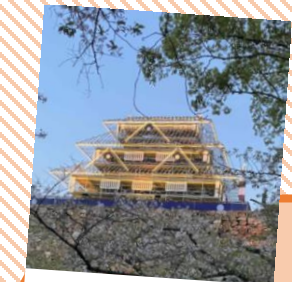
どこのお城でしょう？