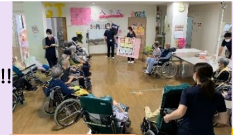
そばチームの勝利

第1回目は、ボールを投げて得点を競う、ポッチャゲームをしました。各々、チーム名を考え「うどんチーム」「ごはんチーム」「そばチーム」にわかれまして。