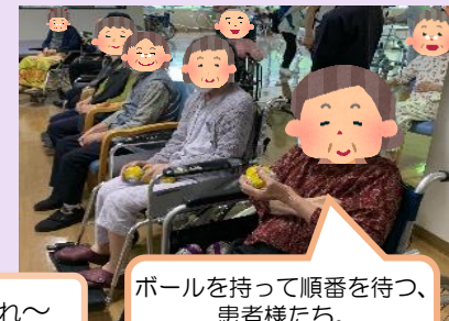
ボールを持って順番を待つ、患者様たち。やる気いっぱいですね◎